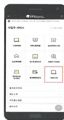
① EPS어플 접속 → [사업주교육] 선택