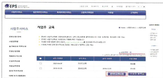
[사업주교육]메뉴 → [온라인교육신청]버튼 클릭