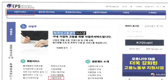
EPS홈페이지( www.eps.go.kr ) 접속