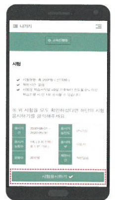
④ 수강 후, [시험응시하기] 클릭