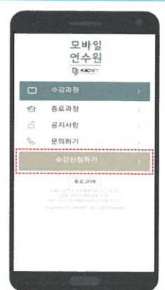
② 학습장 이동 후, [수강신청하기] 클릭